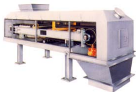
Basculé intégratrice de dosage (Feeder)

Ainsi, RAMSEY peut fournir pour tous matériaux en vrac un Feeder approprié.